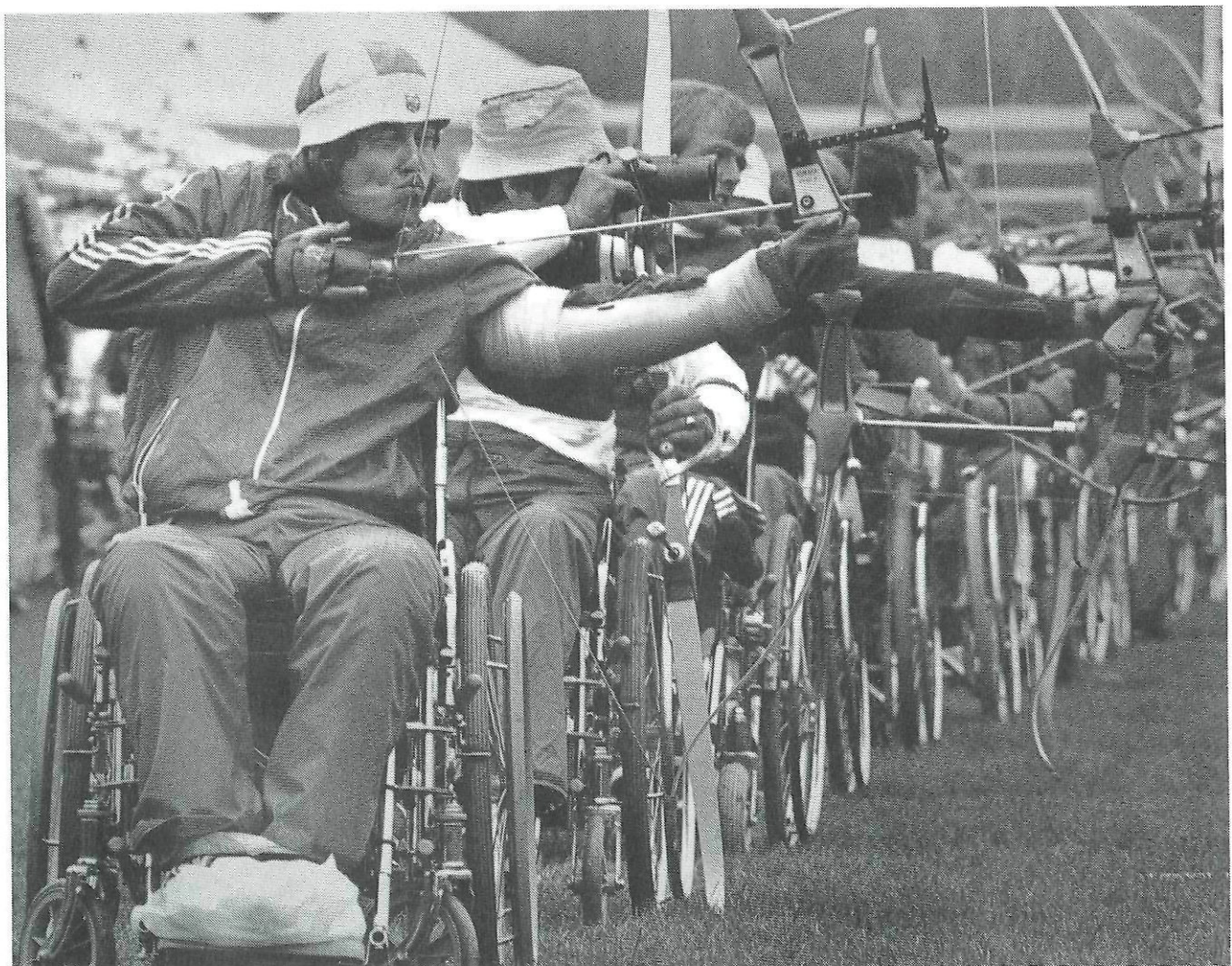
Bågskytte är en av de grenar som integrerats som en naturlig del i det egna specialförbundets ordinarie verksamhet.

(Korpen oräknad). Ett av 63 SF är Svenska Handikappidrottsförbundet (SHIF) som 1969 blev RFs 50:e SF. Idag har SHIF 19 idrotter på sitt program och kan ses som ett RF i miniatyr. Förbundet har idrotter för alla skadegrupper - rörelsehindrade, synskadade, utvecklingsstörda och döva.