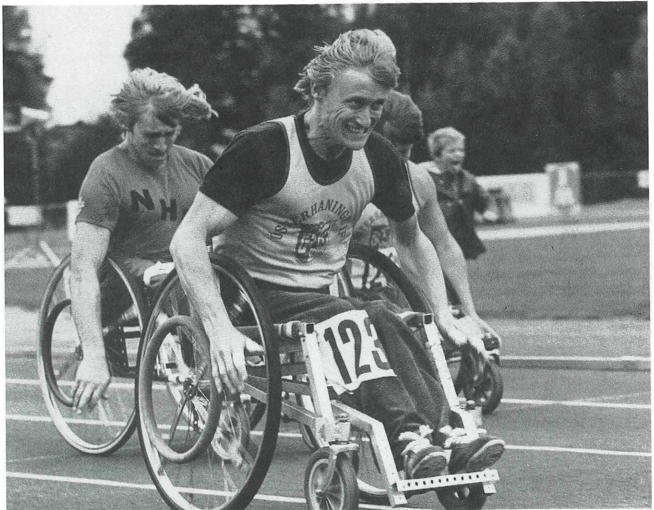
De olympiska spelen för handikappade, Paralympics, har aktivt bidragit till att skapa en ökad förståelse för handikappidrott.

Rehabilitering ses här som ett brett processuellt begrepp som innefattar fysiska, psykiska och sociala dimensioner. Detta ligger också i linje med SHIFs policy där det klart markeras att vid rehabilite-