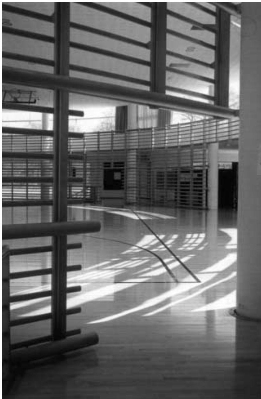
Fredrik IX Hallen, Köpenhamn. Byggt 1999.

folkhemstankens avveckling; på att den tid är förbi när samhället och skolan självklart skulle tillhandahålla – och också fostra medborgarna i – fysisk bildning, måltider, hygienmöjligheter, simundervisning och hälsovård.