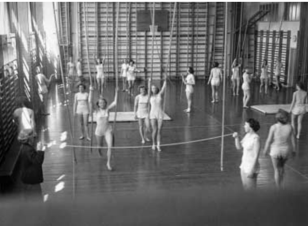
GCI på Lidingövägen i Stockholm på 1940-talet