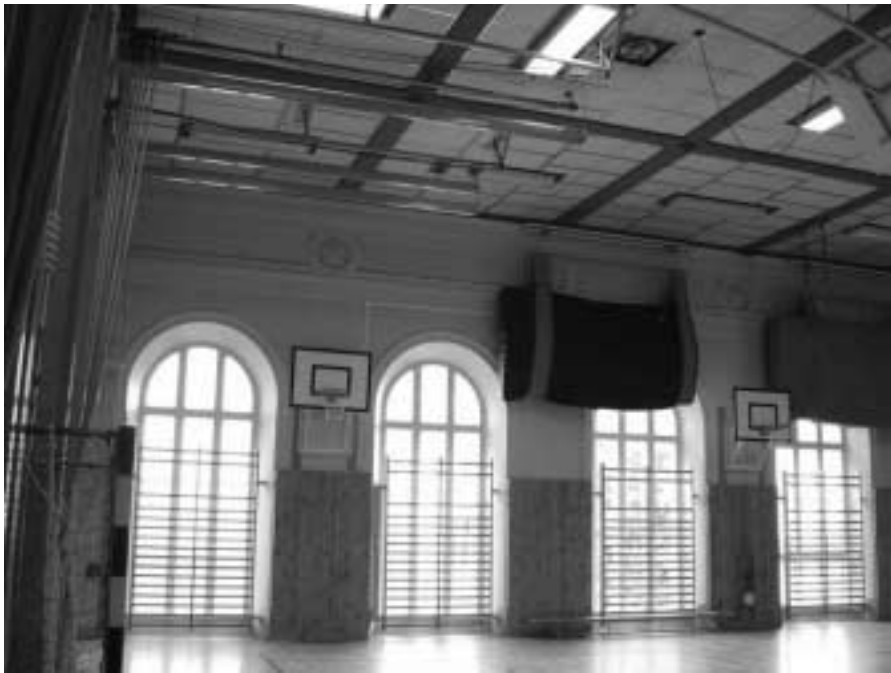
Gymnastiksalen på Per Brahegymnasiet i Jönköping, byggd 1881.

att bli diverse hälsobringande åtgärder inom kroppsövningsämnet.