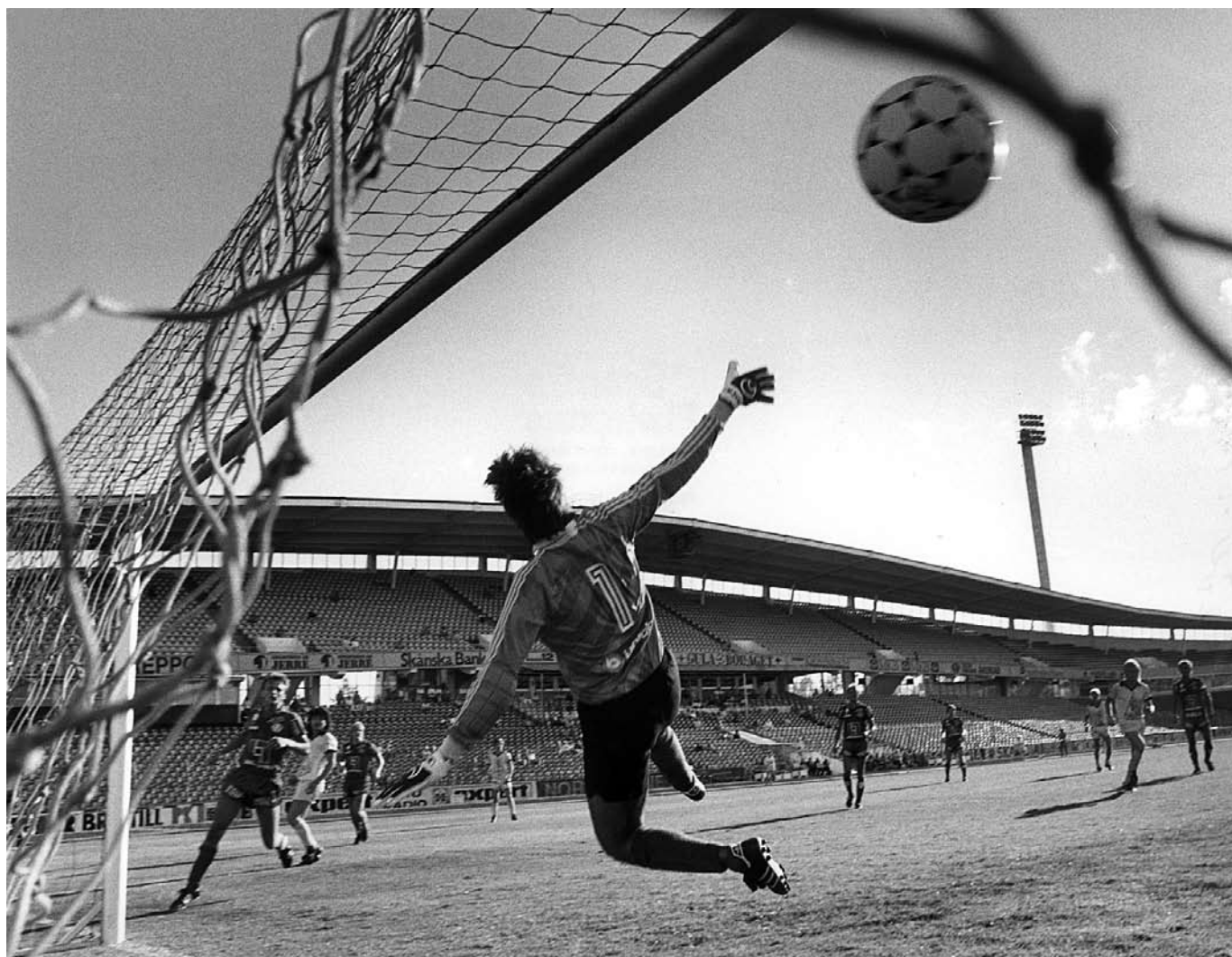
En stor del av ekonomin i en förening är publikintäkter. Massor av publik ger ekonomi för nya spelinköp. Denna cupmatch mellan Helsingborg och IFK Malmö gav inget klirr i kassan.

mersiella intressen får inflytande över verksamhetens form och innehåll. Det tas omotiverade pauser i idrottsmatcher, tävlingar läggs på orimliga tider på dygnet, serier sprids ut över alla veckans dagar, regler ändras, spelare importeras från fjärran länder för att utvidga sändningsmarknader osv. Prestationskrav, som även kan ses som krav på förräntning av investerat kapital, kan dessvärre ofta även leda till doping, skador och sjukdomar som anorexi och bulemi. Tävländets logik, förstärkt av kommersiella motiv och uppbackad av naturvetenskapens alla möjligheter, formar således förfärande möjliga framtidsscenarioer.