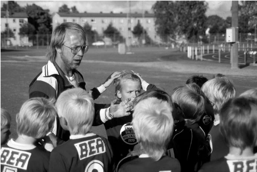
Det oavlönade ideella ledarskapet beräknas motsvara ca 14 miljarder kronor (14 000 000 000 kr). En gigantisk resurs som tillförs samhället.

omfattande ekonomiska resurser. Det är här kommersialismen kommer in, men inte som ensam aktör. När amatörreglerna avskaffades 1967 öppnade sig den gamla folkrörelseorganisationen mot det moderna samhällets två centrala aktörer - staten och marknaden. Samma år beslutade riksdagen om en rad reformer på bidragsområdet, vilka allmänt gynnade föreningsverksamheten, och i idrottens fall gav föreningarna möjlighet att utveckla en ny typ av organisation. Man fick tillgång till avlönade funktionärer istället för den gamla typen av förtroendevalt gratisarbete, trots att det i första hand gällde ungdomsarbetet.