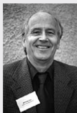
JAN LINDROTH HISTORISKA STITUTIONEN, STOCKHOLMS UNIVERSITET

Den svenska idrottsrörelsen kan uppvisa en formidabel frammarsch under 1900-talet. Den har sedan länge - utan protester - betecknats som landets största folkrörelse. Men färden genom århundradet, under ledning främst av Riksidrottsförbundet (RF), skall inte bara ses som en framgångssaga. Väsentliga vägval har gjorts där vissa värden fått offras. Och i början gick det trögt genom varningar och protester från starka opinionsgrupper. Här skildras några inslag i utvecklingen. För fördjupad kunskap hänvisas till den nyutkomna jubileumsboken "Ett idrottssekel. Riksidrottsförbundet 1903-2003", där även referenser ingår.